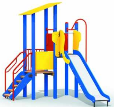
WIDOK PRZYKŁADOWEGO URZĄDZENIA