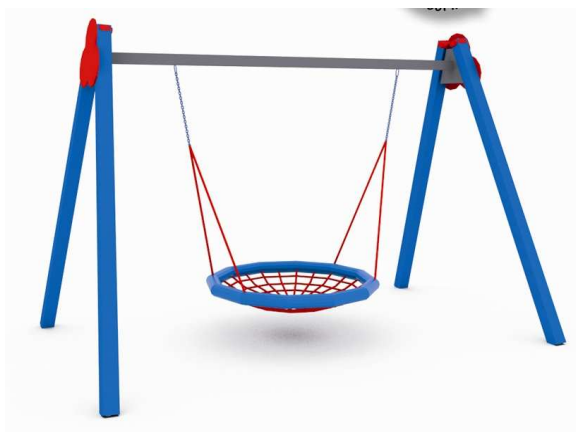
WIDOK PRZYKŁADOWEGO URZĄDZENIA