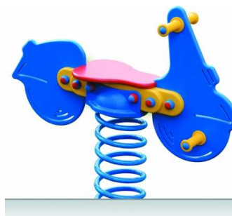
WIDOK PRZYKŁADOWEGO URZĄDZENIA